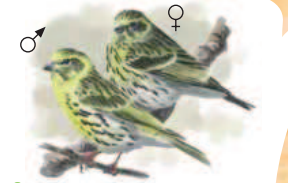
● Verdecillo ( Serinus serinus ) Serin