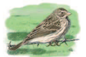
● Triguero ( Emberiza calandra ) Corn Bunting