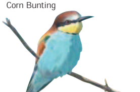
● Abejaruco común ( Merops apiaster ) Bee-eater