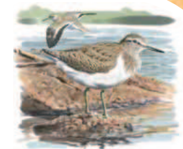
● Andarrios chico ( Actitis hypoleucos ) Common Sandpiper