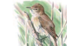
● Carricero común ( Acrocephalus scirpaceus ) Red Warbler