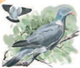
● Paloma torcaz ( Columba palumbus ) Woodpigeon