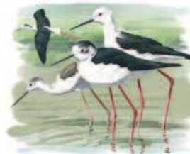
● Cigüeñuela común ( Himantopus himantopus ) Black-winged Stilt