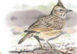
● Cogujada común ( Galerida cristata ) Crested Lark