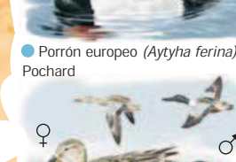
● Pato cuchara común ( Anas clypeata ) Shoveler