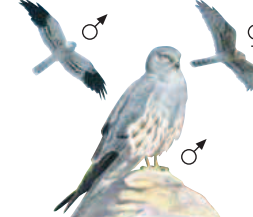
● Aguilucho cenizo ( Circus pygargus ) Montagu's Harrier