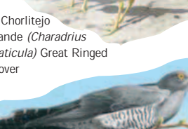
● Cuco común ( Cuculus canorus ) Common Cuckoo