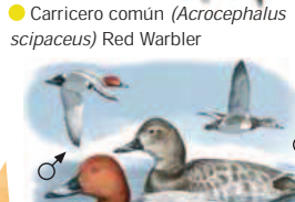
● Porrón europeo ( Aythya ferina ) Pochard