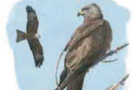
● Milano negro ( Milvus migrans ) Black Kite