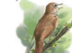
● Ruiseñor común ( Luscinia megarhynchos ) Nightingale