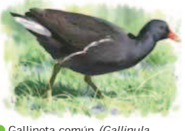
● Gallineta común ( Gallinula chloropus ) Moorhen