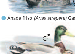
● Anade azulón ( Anas platyrhynchos ) Mallard