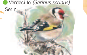
● Jilguero ( Carduelis carduelis ) Goldfinch