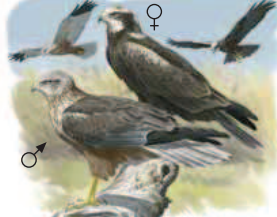
● Aguilucho lagunero occidental ( Circus pygargus ) Montagu's Harrier