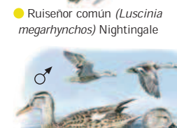
● Anade friso ( Anas strepera ) Gadwall