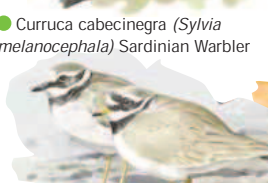
● Chorlitejo grande ( Charadrius hiaticula ) Great Ringed Plover