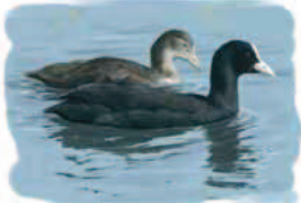
● Focha común ( Fulica atra ) Coot