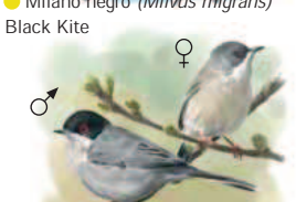
● Curruca cabecinegra ( Sylvia melanocephala ) Sardinian Warbler