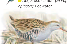
● Rascón europeo ( Rallus aquaticus ) Water Rail