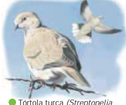
● Tórtola turca ( Streptopelia decaocto ) Collared Dove