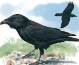
● Cuervo ( Corvus corax ) Common Raven.