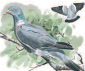
● Paloma torcaz ( Columba palumbus ) Common Woodpigeon.