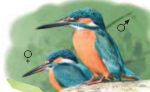
● Martín pescador ( Alcedo atthis ) Common kingfisher.