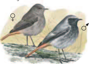
● Colirrojo tizón ( Phoenicurus ochruros ) Black Redstart.

● Residentes / Sedentary birds ● Estivales / Summer birds