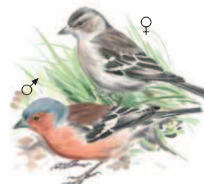
● Pinzón vulgar ( Fringilla coelebs ) Common Chaffinch.