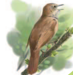
● Ruisenor común ( Luscinia megarhynchos ) Rufous Nightingale.