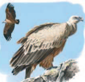
● Buitre leonado ( Gyps fulvus ) Griffon vulture.