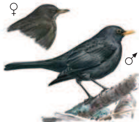
● Mirlo común ( Turdus merula ) Blackbird.