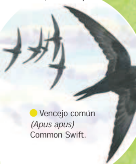
● Vencejo común ( Apus apus ) Common Swift.