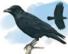
● Corneja negra ( Corvus corone ) Carrion Crow