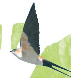
● Golondrina dáurica ( Hirundo daurica ) Red-rumped Swallow.