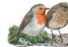
● Petirrojo europeo ( Erithacus rubecula ) Robin