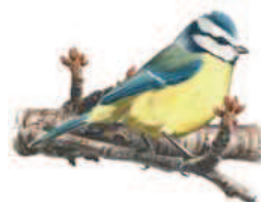
● Herrerillo común ( Parus caeruleus ) Blue Tit.