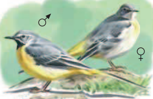
● Lavandera cascadera ( Motacilla cinerea ) Grey Wagtail.