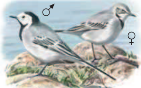
● Lavandera blanca ( Motacilla alba ) White Wagtail.