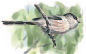
● Mito ( Aegithalos caudatus ) Long-tailed Tit.