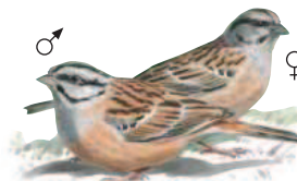
● Escribano montesino ( Emberiza cia ) Rock Bunting.