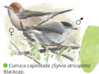
● Curruca capirotdada ( Sylvia atricapilla ) Blackcap.