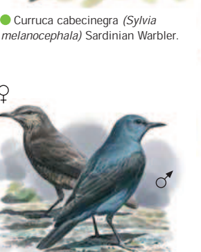
● Roquero solitario ( Monticola solitarius ) Blue Rock Thrush.