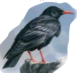
● Chova piquirroja ( Pyrrhocorax pyrrhocorax ) Red-billed Chough.