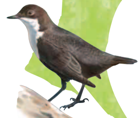
● Mirlo acuático europeo ( Cinclus cinclus ) Dipper.