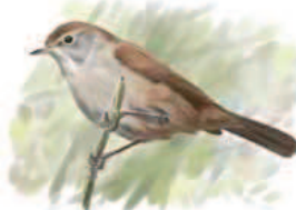
● Ruisenor bastardo ( Cettia cetti ) Cetti's Warbler.