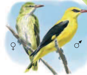
● Oropéndola ( Oriolus oriolus ) Golden Oriole.