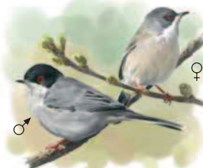
● Curruca cabecinegra ( Sylvia melanocephala ) Sardinian Warbler.